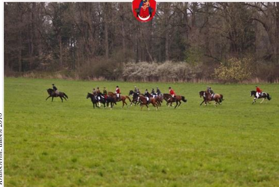
Kratochvíle, duben 2016